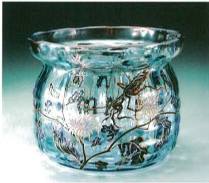
エミール・ガレ 菊にカマキリ文月光色鉢 1884-1889年 直径22.0cm