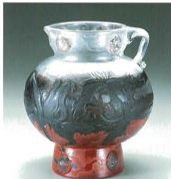
エミール・ガレ 百合文水差《暗い花》 1893年頃 高さ23.0cm