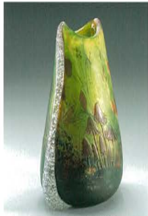
エミール・ガレ ひとよ茸花瓶 1900-1904年 高さ27.5cm