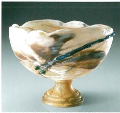
エミール・ガレ 蜻蛉文脚付杯 1904年 直径17.3cm

幕末の開国とともに海を渡った日本の美術工芸品はヨーロッパでブームとなり、印象派やアール・ヌーヴォーなど新しい芸術の誕生に深い影響を与えました。今日「ジャポニスム」と呼ばれるこうした現象のなかで、今まであまり注目されてこなかったのが、工芸品と同じようにあるいはそれ以上に西洋人の心をつかんだキク、スイレン、アヤメ、フジなど日本の植物の存在です。遠く海を渡り西洋の庭を飾ったこれらの花は、アール・ヌーヴォーの巨匠ナンシーのエミール・ガレの庭にも咲き誇っていました。世界各地から集められた2500種を超える草木のなかで、およそ400種類が日本関連の品種であったと伝えられています。ガレは日々その成長を観察し創作の糧としていました。今年開館35周年を祝う北澤美術館では、ガレとその良きライバルのドーム兄弟、彼らの後輩ルネ・ラリックのガラス工芸品のなかから、日本の花をテーマとする作品を選び、ジャポニスムの知られざる一面をご紹介します。世界屈指といわれる北澤美術館のガラス・コレクションを新たな視点でお楽しみいただく特別企画です。お誘いあわせの上お出かけください。