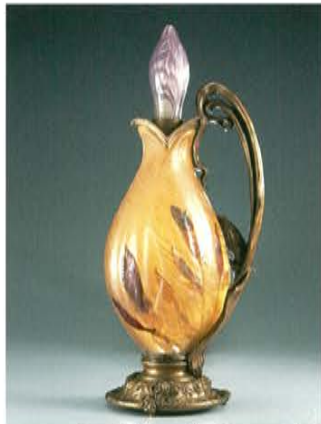
エミール・ガレ 花形ランプ「アイリスのつぼみ」 1900年 高さ45.8cm