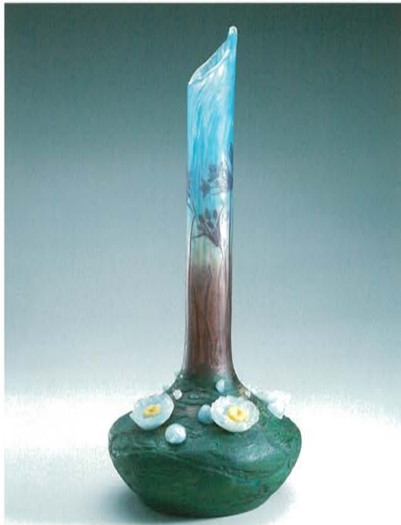
ドーム兄弟 睡蓮文鶴頸花瓶 1909年頃 高さ54.0cm