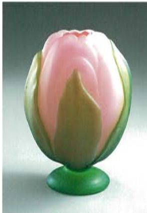
ドーム兄弟 睡蓮のつぼみ 1906年 高さ14.6cm